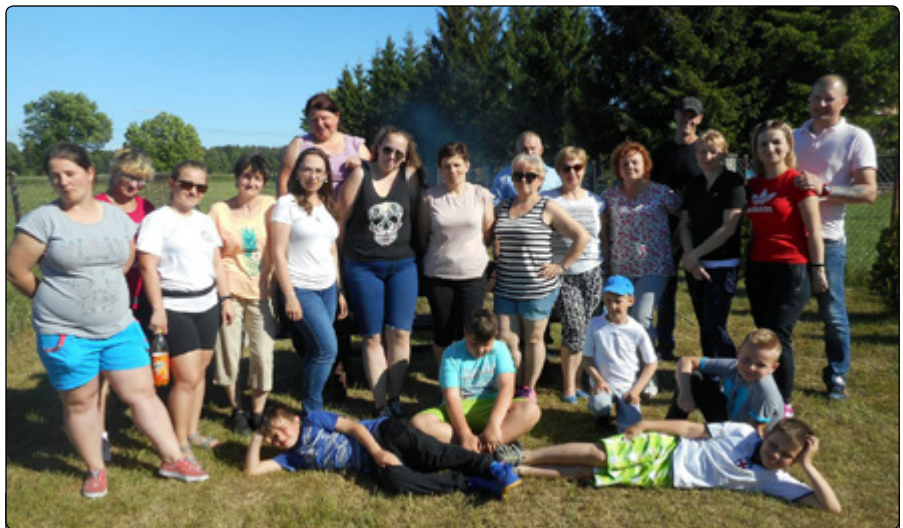
Uczestnicy i uczestniczki „Pikniku z kapliczką w tle” w Połoni 2 VI 2019 r.

Na pierwszą z tegorocznych wypraw wybraliśmy się do Małowidza i Połoni. Oprócz historii przydrożnych kapliczek, figur i krzyży w tych wsiach poznaliśmy opowieści związane z dwudziestowieczną historią; wątkami z Wielkiej Wojny, okresu międzywojennego, działalności antyhitlerowskiej i antykomunistycz-