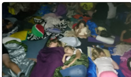
Noc w szkole w Żelaznej Rządowej

Niektórzy uczniowie pierwszy raz spędzali noc poza domem. „Sypialnią” była sala gimnastyczna, a podczas przygotowywania miejsc do spania pojawiały się okrzyki zachwytu i radości. W sobotę o godzinie 6:00 rano wszyscy z uśmiechem na twarzy udali się na wspólne śniadanie i porządkowanie sal.