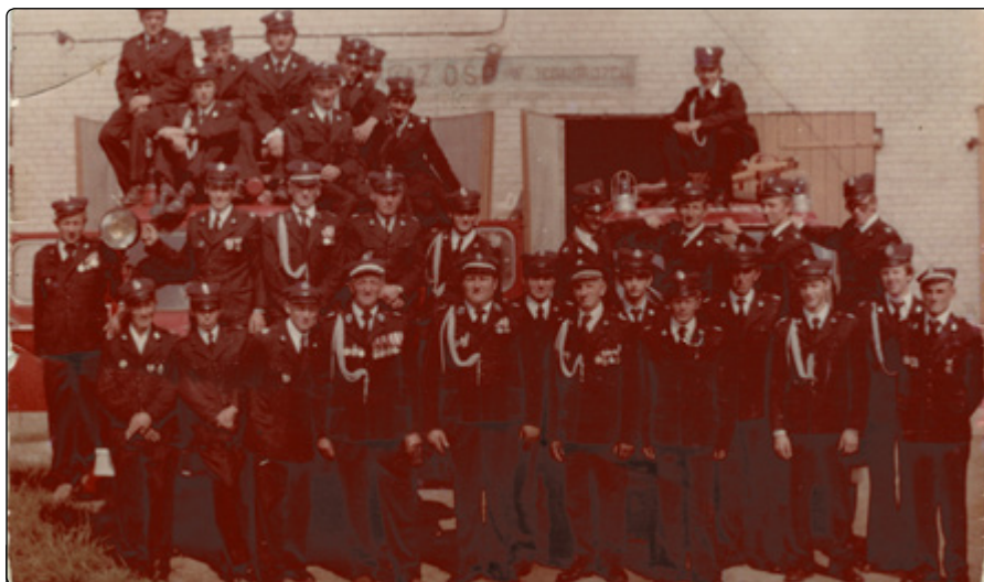
Strażacy z OSP Jednoróżeć przed remizą w latach 80. XX w.

Służba ta charakteryzuje się przede wszystkim zachowaniem gotowości i nieprzewidywalnością. Jednocześnie szeroki wachlarz działań podejmowanych przez druhow strażaków sprawia, że niejednokrotnie są oni zmuszeni do całodobowej dyspozycyjności. Tym samym czas spędzony w murach remizy, na wyjazdach czy podczas zabezpieczania imprez lokalnych sprawia, że dzieje się to kosztem rodziny. Tym samym tak ważna jest wyrozumiałość naj-