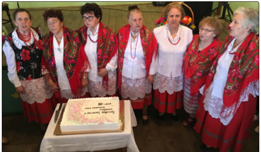
Jubilatki z Żelaznej z okolicznościowym tortem