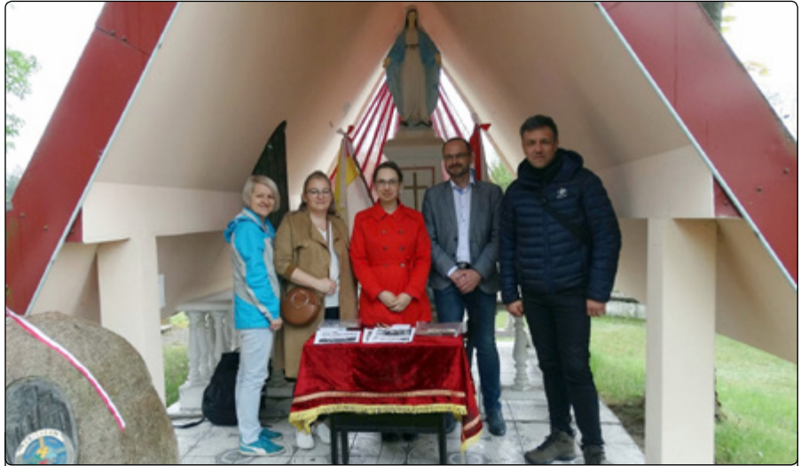
Przedstawiciele S „PZJ” na konsultacjach w Parciakach

Po tym, jak zespół przygotowujący wystawę wybierze zdjęcia, które znajdą się na tablicach, pracę przejmie grafik, który opracuje projekt. Następnie po wydruku wystawa zostanie zamontowana w centrum wsi Parciaki, zapewne przy kościele. Jej uroczyste odsłonięcie planujemy na niedzielę 15 września.