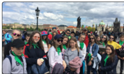
Uczniowie z Parciak i Żelaznej w Pradze

Na koniec zwiedziliśmy wrocławski Rynek. Jest on zabudowany urokliwymi, kolorowymi kamienicami z różnych epok. Mogliśmy podziwiać również Stary Ratusz, który jest unikatowym zabytkiem świeckiej architektury późnogotyckiej.