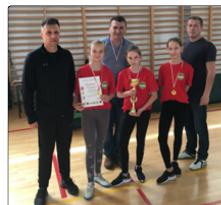
Mistrzyni z Żelaznej i Parciak z opiekunem i organizatorami

Wśród naszych uczniów są wybitni zawodnicy tenisa stołowego. Talent to jednak nie wszystko, ponieważ żeby