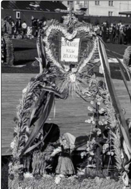
Wieniec dożynkowy KGW z Żelaznej Rządowej na dożynkach wojewódzkich w Przasnyszu w 1988 r.