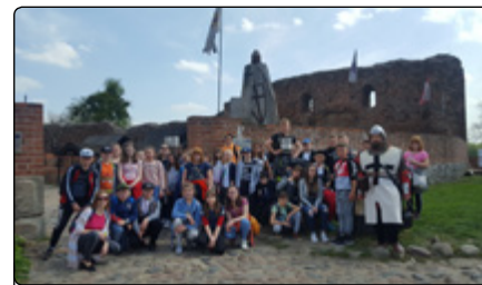
Z Krzyżakiem za przewodnika

w Domu Legend. Ponadto uczestnicy wycieczki wyrabiali i wypiekali pierniki w Domu Piernika. Pracownicy tego miejsca urzekli nas swoim mieszczkańskim strojem oraz językiem typowym dla XV-wiecznego Torunia. Wieczorem nie zabrakło nam jednak sił, by zagrać na świeżym powietrzu w piłkę, tenisa czy badminton.