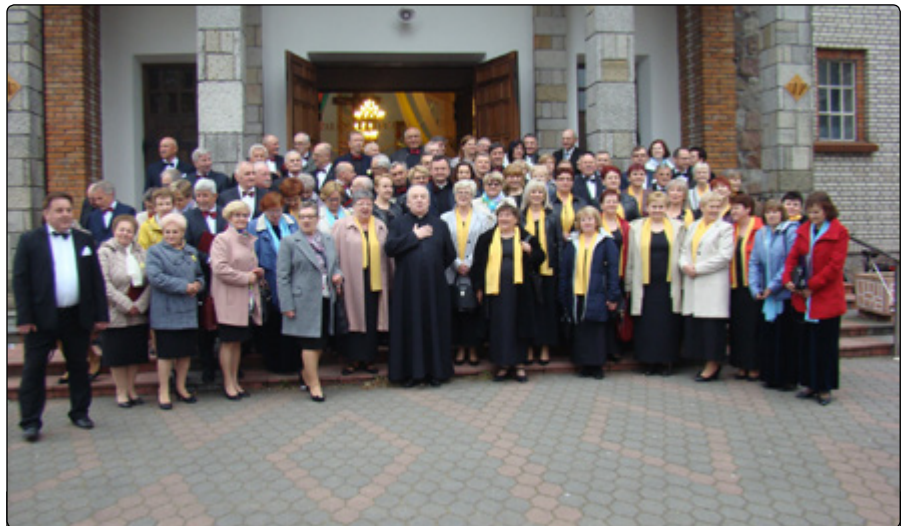
Uczestnicy i uczestniczki XII Koncertu Pieśni Wielkanocnych w Jednoróźcu

Koncert cieszył się ogromnym zainteresowaniem mieszkańców, jak i foto-