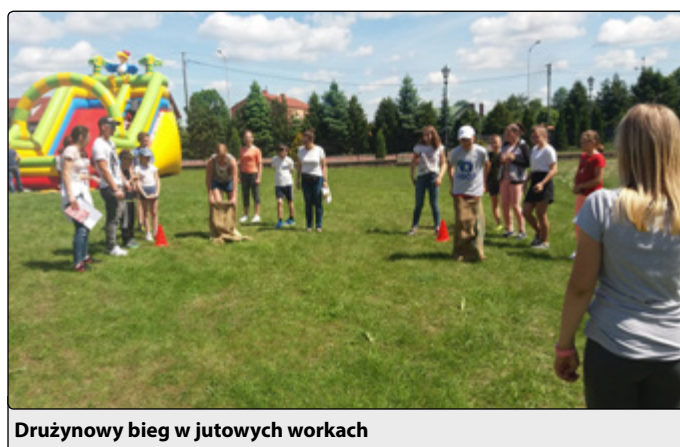
Drużynowy bieg w jutowych workach

Dziękujemy ks. proboszczowi ks. A. Kronowi za użyczenie miejsca do zabawy, pracownikom GZUK i Strażakom za rozstawienie dmuchańców, a Gminnej Bi-