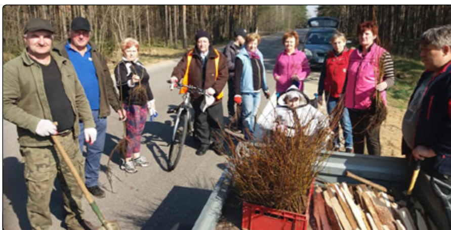
Członkowie S„PZJ” i mieszkańcy Lipy podczas sadzenia lip

Przedsięwzięcie zostało zrealizowane w ramach działania stowarzyszenia zaplanowanego na 2018 rok „1000 lip na setne urodziny Polski”, które nie odbyło się w zaplanowanym czasie. Pozostało w pamięci członków zarządu, którzy zaproponowali odnowienie inicjatywy. W toku wewnętrznych dyskusji oraz po konsultacjach z Powiatowym Zarządem Dróg podjęliśmy decyzję o zrealizowaniu akcji pod hasłem „Aleja lip do Lipy”. Sadzonki drzew pozyskaliśmy z Nadleśnictwa Budziska, za co bardzo dziękujemy.