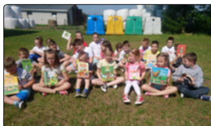
Mali czytelnicy z Żelaznej Rządowej

W dniu 7 VI 2019 r. o godz. 10:00 uczniowie klas I–VIII Publicznej Szkoły Podstawowej Żelazna Rządowa-Parciaki wzięli udział w ogólnopolskiej akcji „Jak nie czytam, jak czytam” i czytali – bez przymusu, każdy to, na co miał ochotę. Celem tej akcji było pobicie rekordu w liczbie osób czytających w jednym momencie.