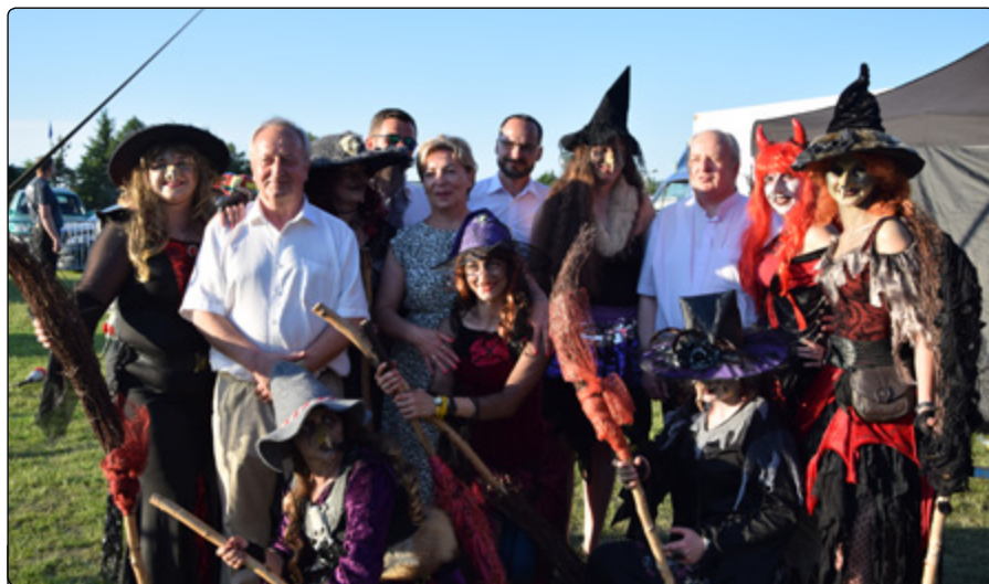
„Wiedźmuchy” opanowały Jednorożec

Obchody „Dnia Jednorożca” były barwne i różnorodne, obfitowały w wiele atrakcji. Jako organizatorka mam nadzieję, że ta wspólna i wyjątkowa impreza będzie miłym wspomnieniem dla wszystkich uczestników wspólnego świętowania.