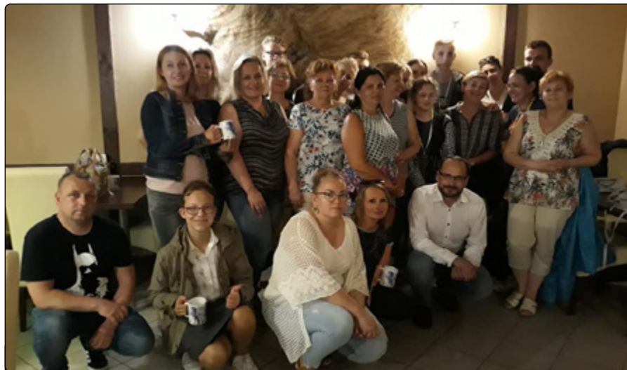
Uczestnicy i uczestniczki finałowej zabawy MultiQuiz w sezonie wiosennym

Czwartkowe wieczory spędziliśmy w miłej i wesołej atmosferze z lekką nutką rywalizacji, która mobilizowała i dodawała emocji. Faktem jest, że emocje ze spotkania na spotkanie były