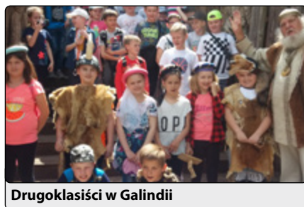
Drugoklasiści w Galindii

W Rucianym Nida płynęli statkiem po Jeziorze Nidzkim, zwiedzali Port u Faryja, gdzie podziwiali krajobrazy mazurskich jezior. Następnym punktem wycieczki był pobyt w Iznocie (laskie Galindów), gdzie zwiedzali Święty Gaj, polanę obrzędów, podziemne grotty