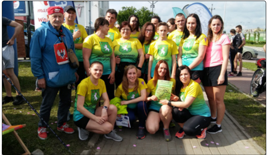
W sztafecie charytatywnej na 12 km wzięło udział 27 naszych zawodników

„Zabiegana” ekipa ma szereg dokonań sportowych, które niewątpliwie motywują i budują markę drużyny. Poza biegaczami możemy tu również spotkać pasjonatów nordic walking’u, rowerzystów, rolkarzy, a w tym roku również morsów. Poza tym JRCM jest organizatorem treningów, gdzie angażuje lokalną społeczność, która chętnie