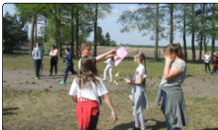
Uczniowie w trakcie prób puszczania latawców

Idea organizacji Dnia Ziemi nie jest nowa i ma swoje źródło w latach 70. XX w. Wówczas to narodził się wśród ekologów pomysł, aby w związku z postępem technologicznym i licznymi zagrożeniami cywilizacyjnymi, jaki on niesie, wzmóc działania na rzecz ochrony środowiska, które jest naszym wspólnym dobrem. Wymyślono go po to, by miliardy ludzi pochylili się nad losem planety, na której żyją. Na całym świecie tysiące stowarzyszeń ekologicznych organizuje manifestacje, konferencje, pokazy i akcje na rzecz środowiska naturalnego. Główny cel jest uświadomienie problemów związanych ze zmianami klimatu, przeludnieniem, wymieraniem gatunków czy brakiem wody. Taka ekologiczna refleksja ma nas uchronić przed popełnianiem kolejnych błędów i skłaniać do kształcenia proekologicznych nawyków w życiu codziennym.