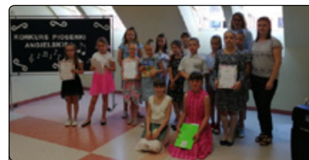
Dumni zwycięcy i uczestnicy konkursu języka angielskiego

W dniu 5 VI 2019 r. w klasach I–III Publicznej Szkoły Podstawowej im. A. Chętnika w Jednorozcu odbył się konkurs piosenki anglojęzycznej. Jego celem było rozwijanie zainteresowania j. angielskim, poszerzenie zasobu słownictwa oraz umiejętności słuchowych i dykcji w j. angielskim.