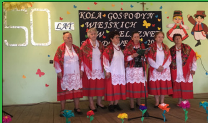
Występ członkiń KGW w Żelaznej Rządowej