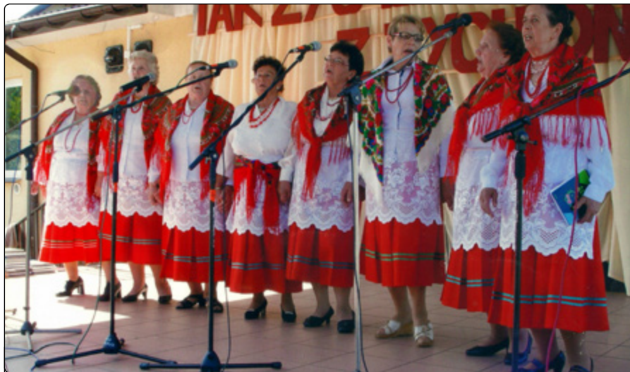
Członkinie KGW z Żelaznej Rządowej podczas jednego z występów