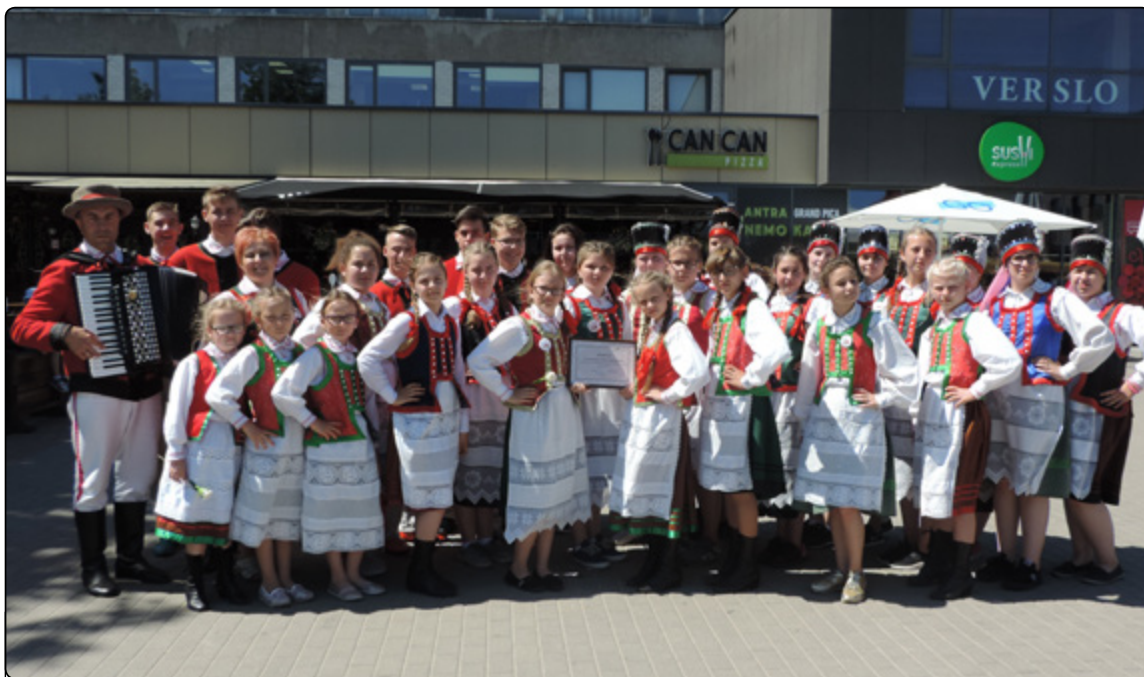
Młode Kurpie w Poniewieżu

Uczestniczyliśmy również w XVII Festynie Kultury Polskiej „Znad Issy” w Kiejdanach oraz VI Festiwalu Kultury Polskiej w Poniewieżu. Uroczystościom towarzyszyły spotkania z władzami miast. Mieliliśmy też okazję wysłuchać wystąpienia Konsula RP podczas spotkania literackiego w Kiejdanach. Ponadto zwiedziliśmy wystawy w Muzeum Rzeźb W. Ulewicza w gmachu Samorządu Kiejdan. Wiezorami młodzież nasza świetnie się integrowała z dziećmi i młodzieżą z „sąsiedztwa”. Nawet znajomość języków obcych miała zastosowanie