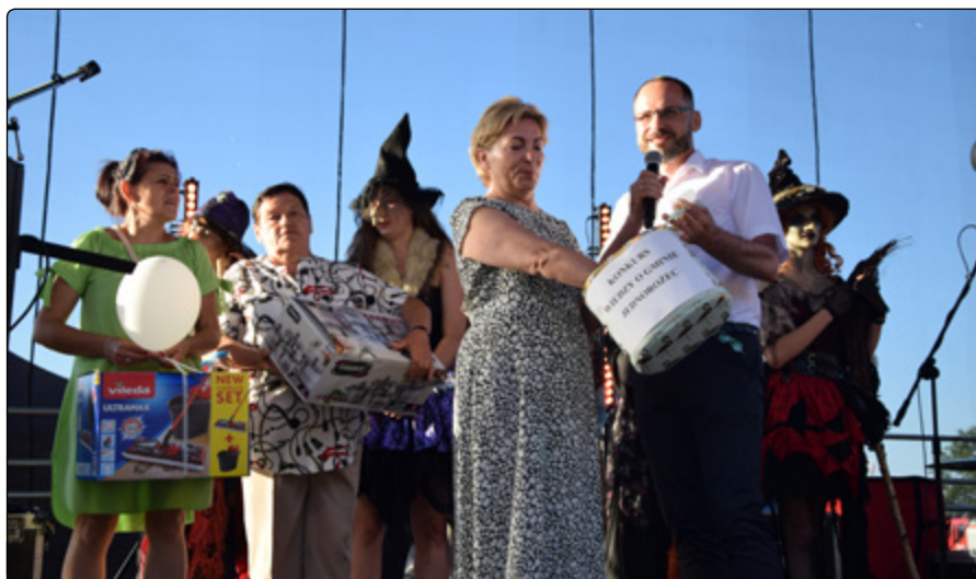
Losowanie nagród w konkursie wiedzy o gminie Jednorożec

W tym dniu wiele się działo, a wszystko za sprawą atrakcji, jakie zostały przygotowane dla obecnych na festynie: był sport, żywy folklor, kon-