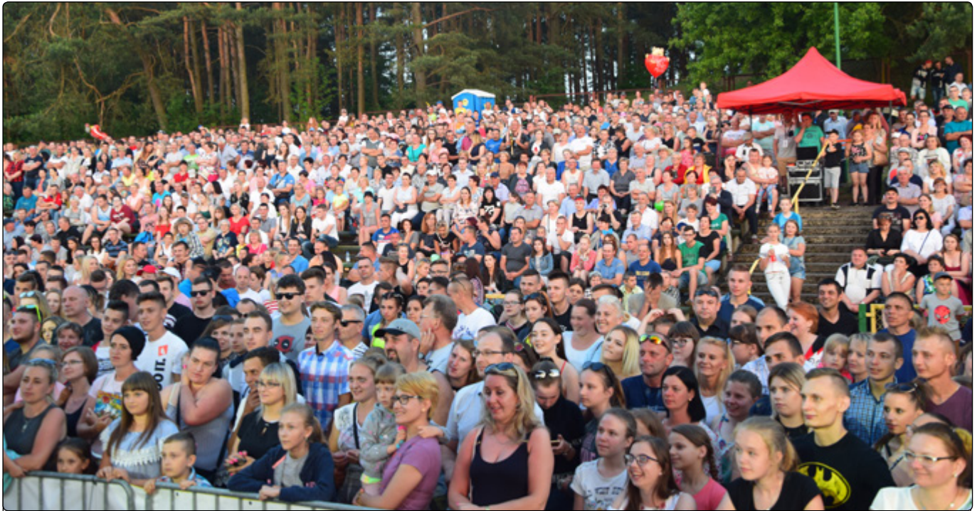
Licznie zgromadzona publiczność