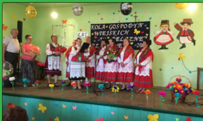
Zaproszeni goście składają życzenia Paniom świętującym jubileusz