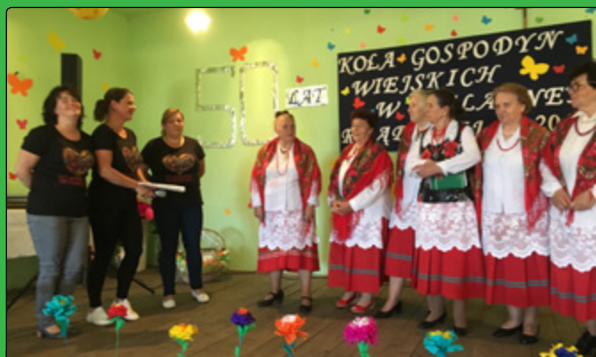
„Żelaźnianki to Kurpianki” składają życzenia seniorkom KGW Żelazna Rządowa