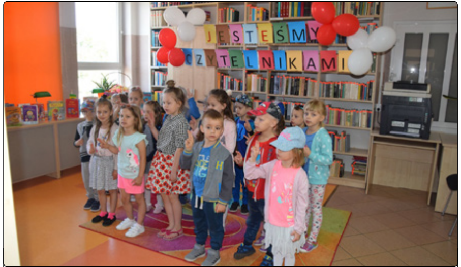
Ślubowanie młodych czytelników

Spotkaliśmy się, aby porozmawiać i zapoznać z zasadami, jakie obowiązują w bibliotece. Dzieci poznały reguły wypożyczania książek oraz korzystania z czytelni. Mamy nadzieję, że są już przygotowane na nowy etap w swoim życiu. Uważamy, że wraz z tą wizytą każde z nich zrozumie, jaką radość sprawia samodzielny wybór ciekawej książki. Celem spotkania było nie tylko zapoznanie dzieci z działalnością biblioteki, ale przede wszystkim wprowadzenie w magiczny świat bajek, baśni i legend, poza tym rozbudzanie chęci sięgania po nie oraz wyrabianie prawidłowych nawyków czytelniczych. Staraliśmy się także wzbudzać szacunek do książki. Jednocześnie jako bibliotekarze