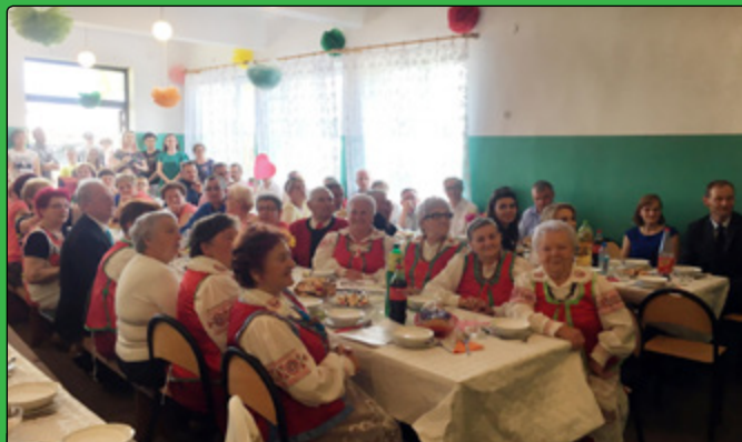
Liczenie przybyli goście